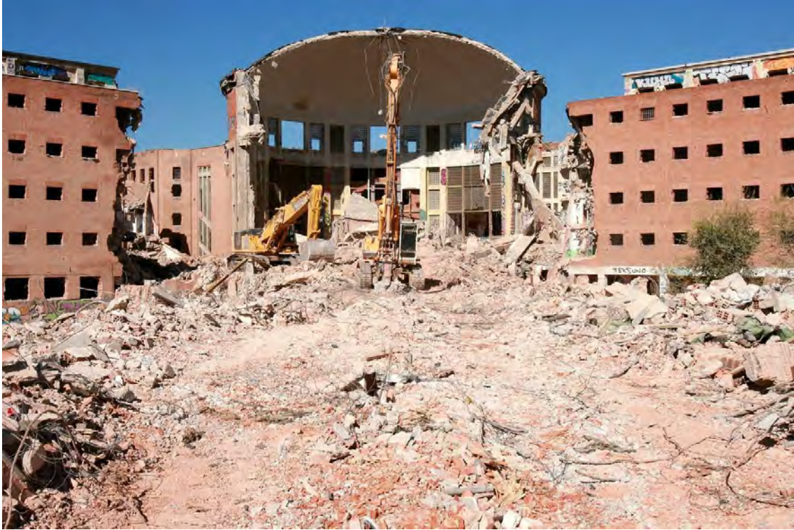
Fig. 13. Demolición de la Cárcel de Carabanchel de Madrid en el año 2008, España. Fotografía de Jaime García (La Voz de Cádiz).