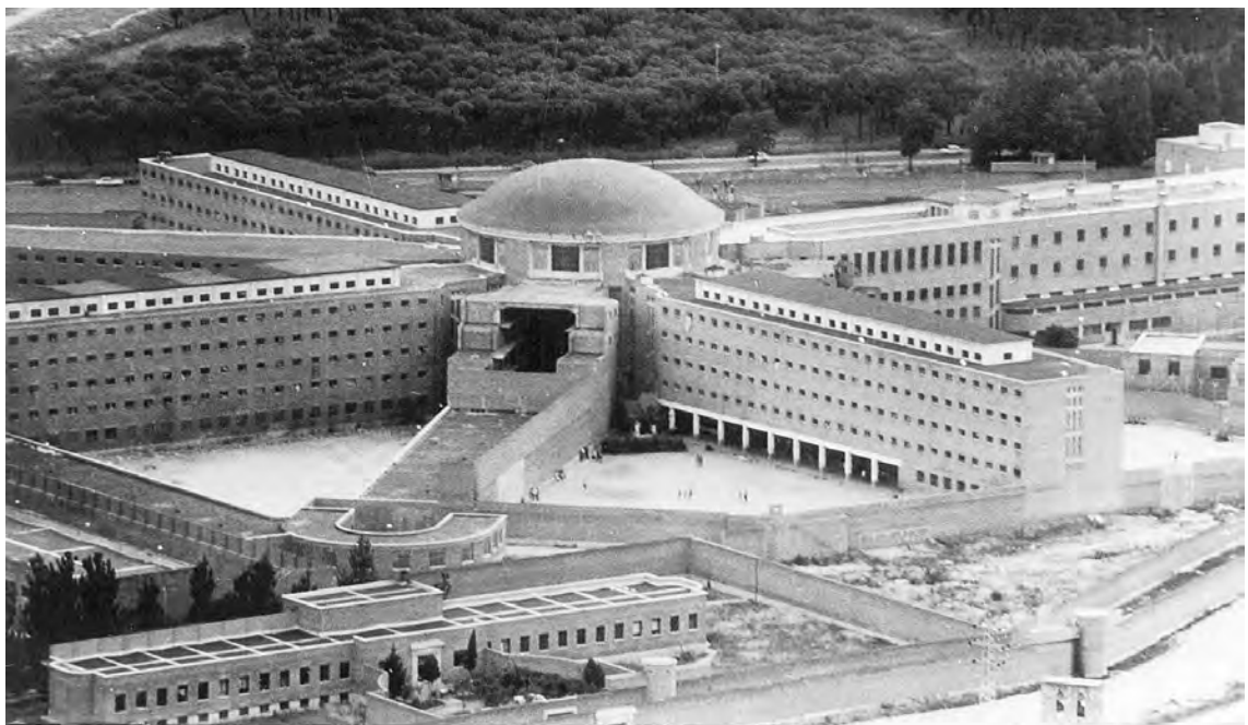
Fig. 12. Vista del panóptico de la Cárcel de Carabanchel de Madrid, España. Fotografía de El Mundo (6-XII-2021).