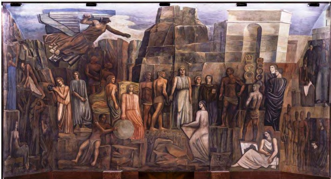
Fig. 8. Mural de Mario Sironi en la Universidad de la Sapienza en Roma, Italia.