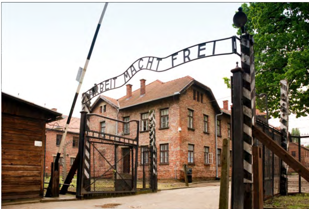
Fig. 4. Puerta de entrada de Auschwitz I, donde se observa el letrero con la frase Arbeit macht frei (el trabajo hace libre), Polonia.