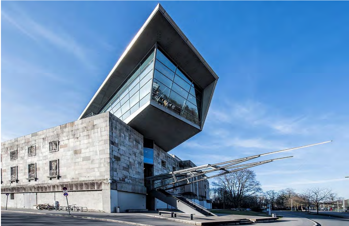
Fig. 7. Centro de Documentación sobre la historia del partido nazi ( Dokumentationszentrum Reichsparteitagsgelände ) en Nuremberg, Alemania.