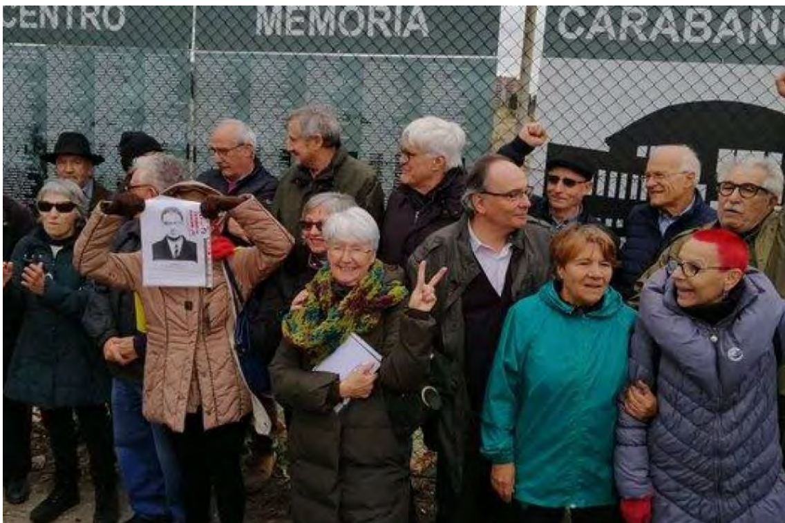
Fig. 14. Expresos y presas de la dictadura franquista frente al memorial alternativo instalado frente a la antigua cárcel de Carabanchel, España. Fotografía de Público (23-VI-2020).