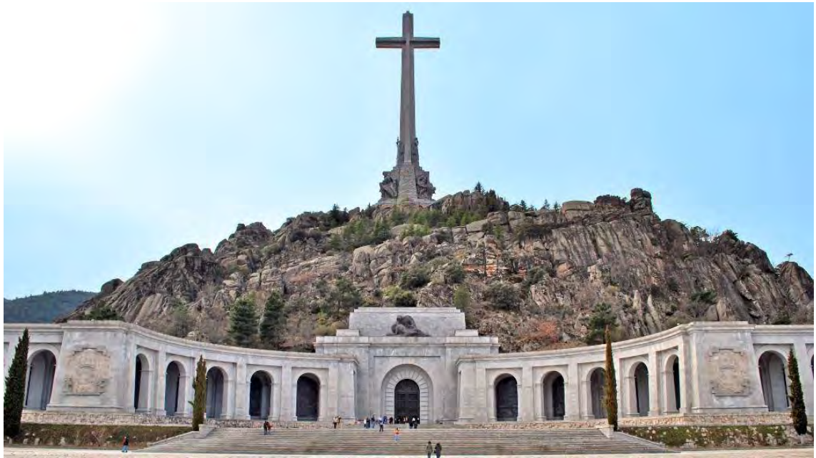
Fig. 11. Entrada a la cripta y vista de la cruz del Valle de los Caídos, España. (28-IX-2018).