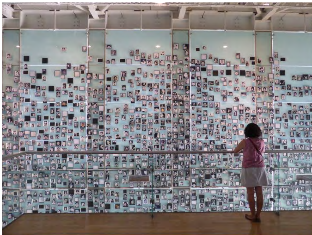
Fig. 1. Retratos de víctimas en el Museo de la Memoria y los Derechos Humanos, de Santiago de Chile, Chile.