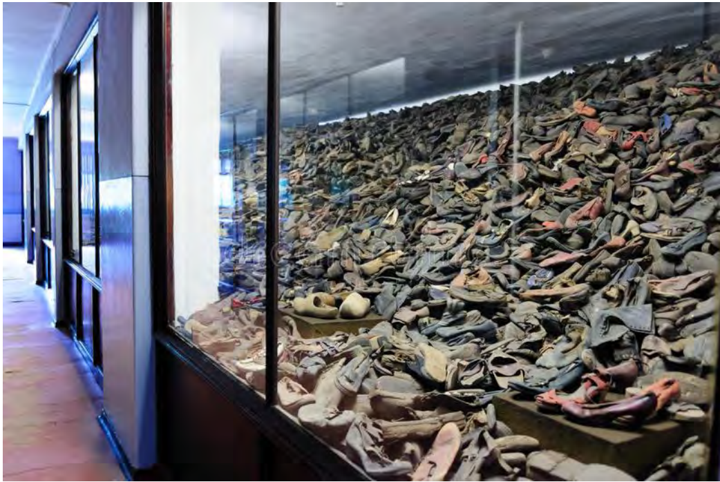
Fig. 5. Exhibición en el bloque 5 de zapatos de los distintos presos de Auschwitz I.