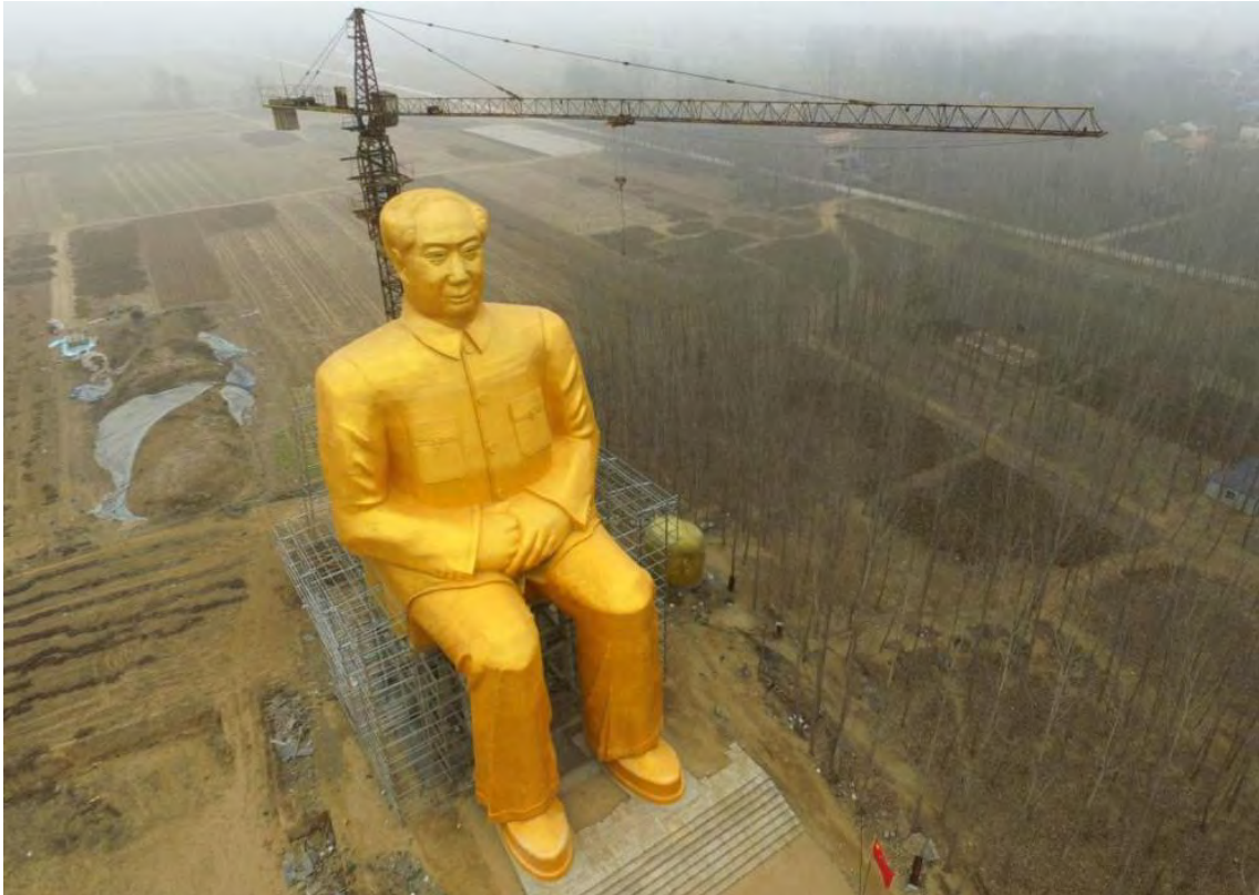
Fig. 3. La estatua dorada gigante de Mao Zedong en Tongxu. Fotografía de Reuters (El Mundo (5-I-2016)).