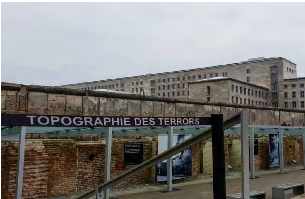
Fig. 6. Topografía del Terror de Berlín ( Topographie des Terrors ), Alemania.