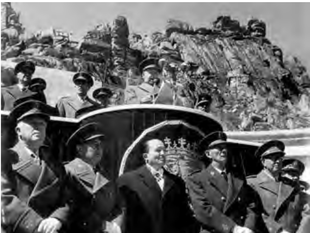
Fig. 10. El Jefe del Estado, Francisco Franco, inaugura el Valle de los Caídos, España.